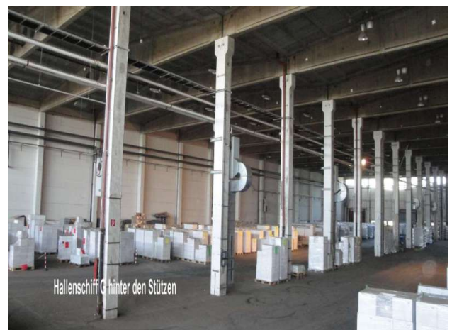
■ zwei Hallenschiffe mit Mittelstütze