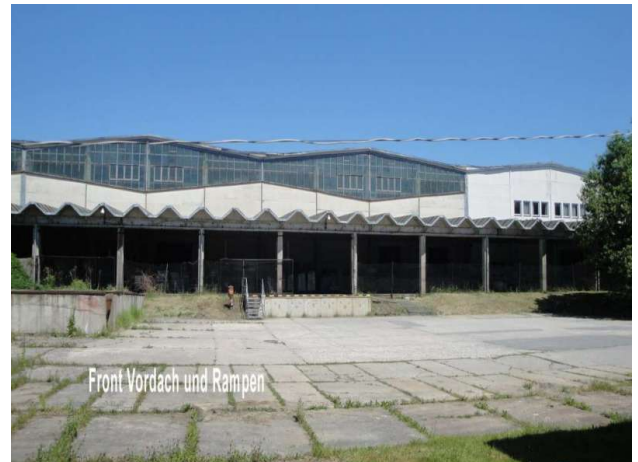
■ Rampenanlage überdacht