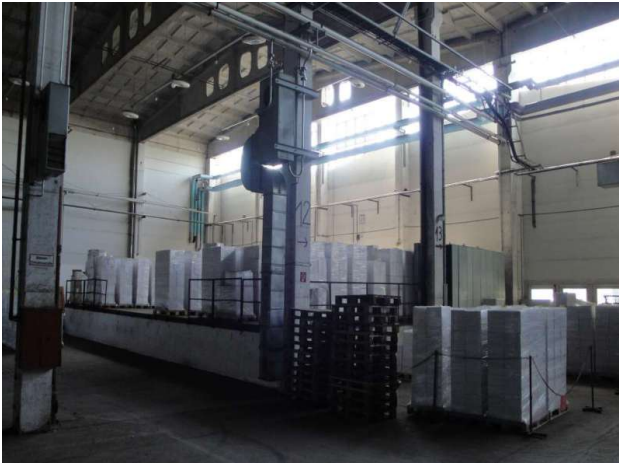
■ Rampe innerhalb eines Hallenschiffes