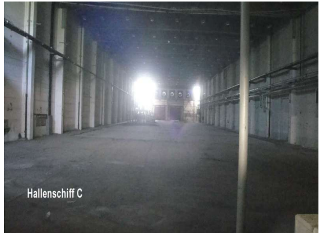
■ Hallenschiff Stützenfrei