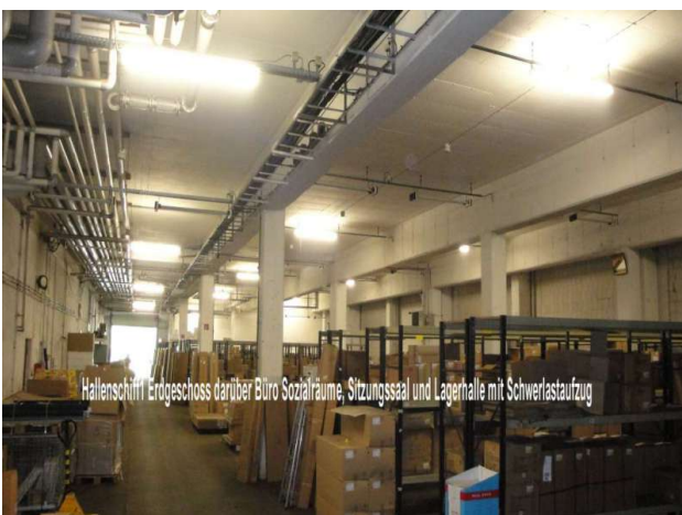
■ Hallenschiff mit zwei Etagen