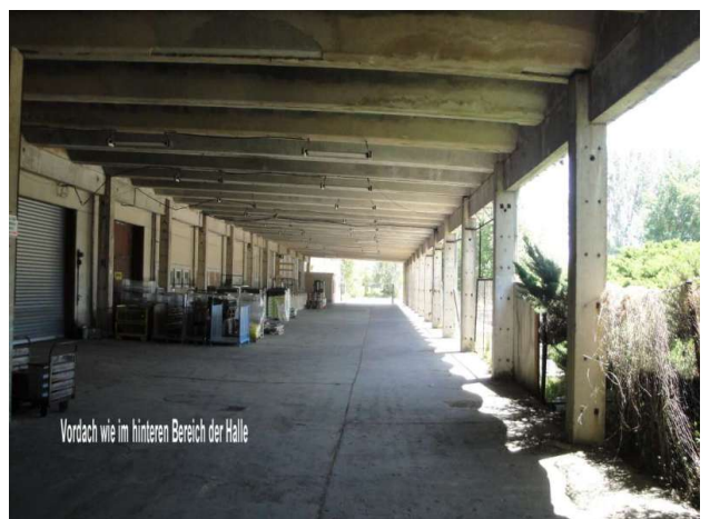
■ überdachte Rampe befahrbar