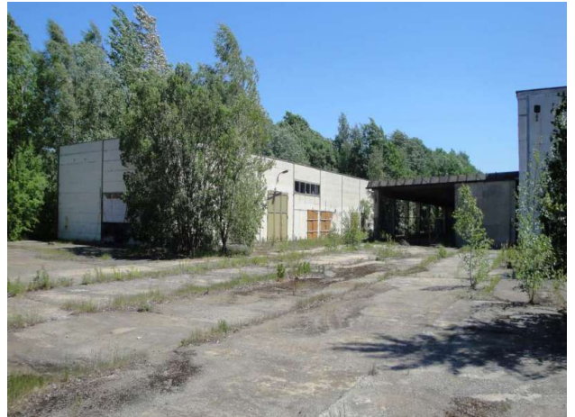
■ Nebenglass Werkstatt